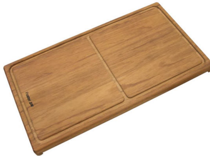
Verschiebbares Schneidebrett aus Iroko-Holz 8643 000