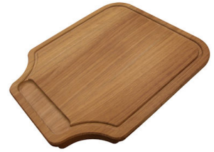
Schneidebrett aus Iroko-Holz 8647 000